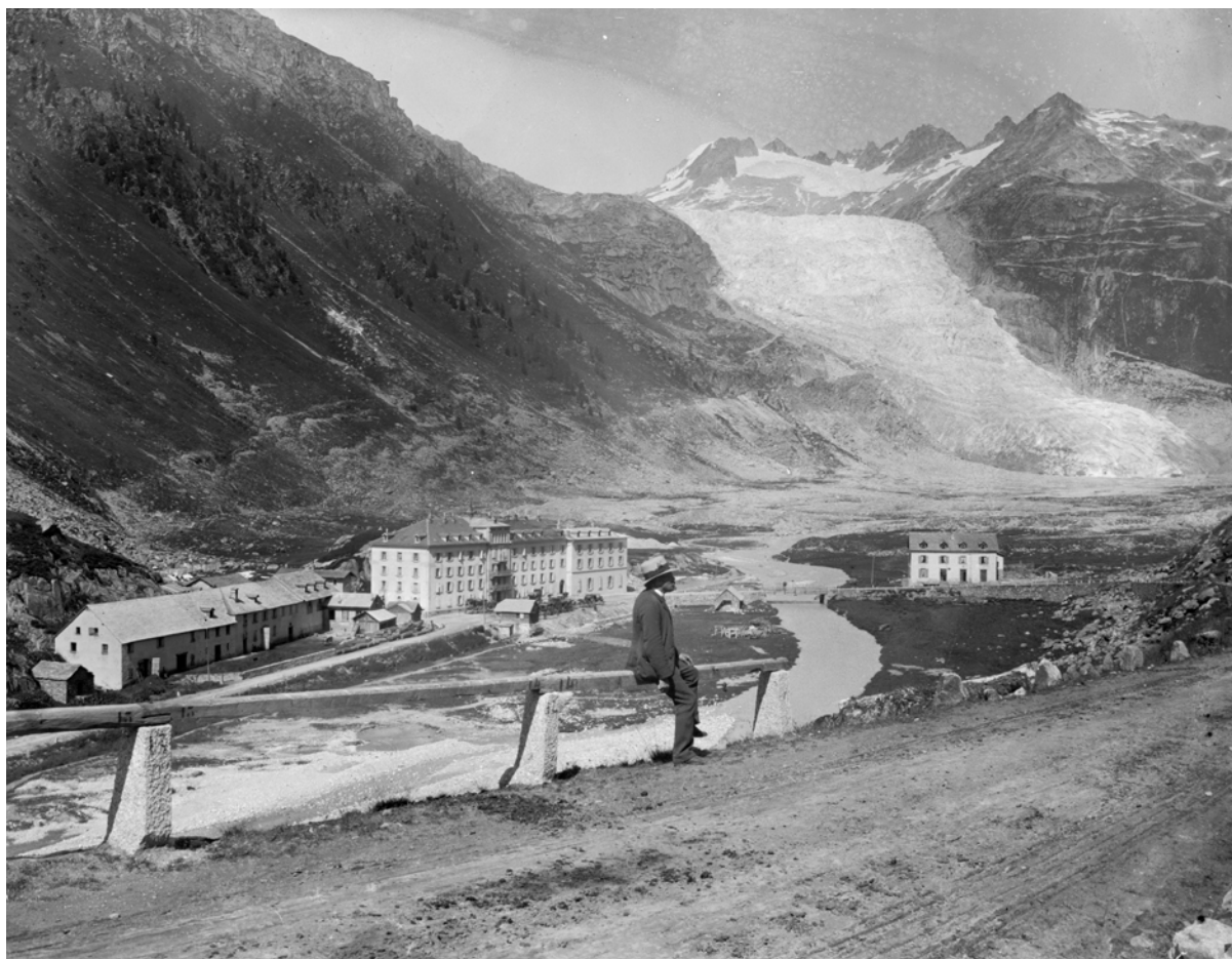
© André Schmid, Vue sur l'hôtel de Gletsch et le glacier du Rhône, 1891, coll. du Musée historique Lausanne

13 ème colloque sur le RHÔNE dans son environnement naturel et humain